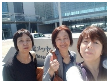
会場の朱鷺メッセにて参加者一同 地酒も楽しめず発表準備・・・