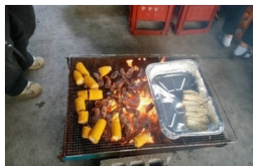
日南野菜はおいしい