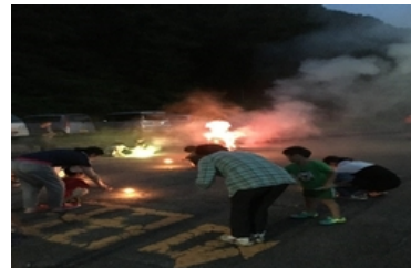
花火で大盛り上がり

前日から準備をしてくれたスタッフに感謝し、また、来年も皆さまが元気で参加してくれることを願って解散しました。