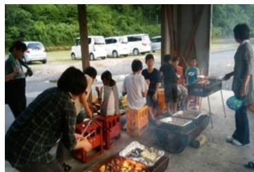
ジュウジュウ焼いています

保育園児の愛?のキューピットをする場面に大笑いして、たいへん楽しく過ごす事が出来ました。(^-^;)