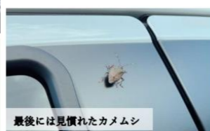
最後には見慣れたカメラ