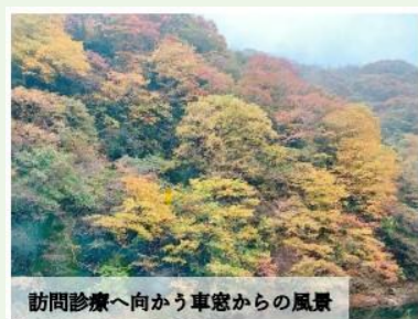
訪問診療へ向かう車窓からの風景

日南町は鳥取県の南西の内陸部にある町で、日野郡に属しています。総人口は約4000人で、人口密度は11.6人/km 2 、2015年～2020年までの人口減少率は-12%であり、65歳以上の人口は約52%とされています。周囲を山々に囲まれた日南町では、美しい自然が織りなす絶景を満喫することができます。私が研修を行った10月から11月は、紅葉で山々が赤や黄色に染め上げられていく様子を見られる時期であり、その美しさに感動しました。