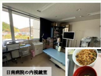
日南病院の内視鏡室