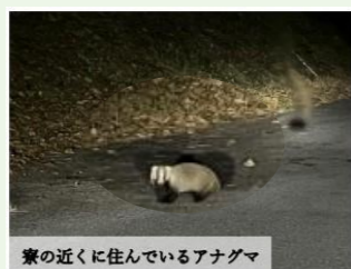
家の近くに住んでいるアナグマ

人口が少ないことから、夜間の明かりも少なく、夜には満天の星空を見上げることができましたし、研修医宿舎の近くでアナグマに遭遇する頻度も高く毎日が楽しかったです。