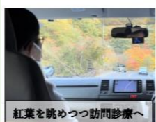
紅葉を眺めつつ訪問診療へ