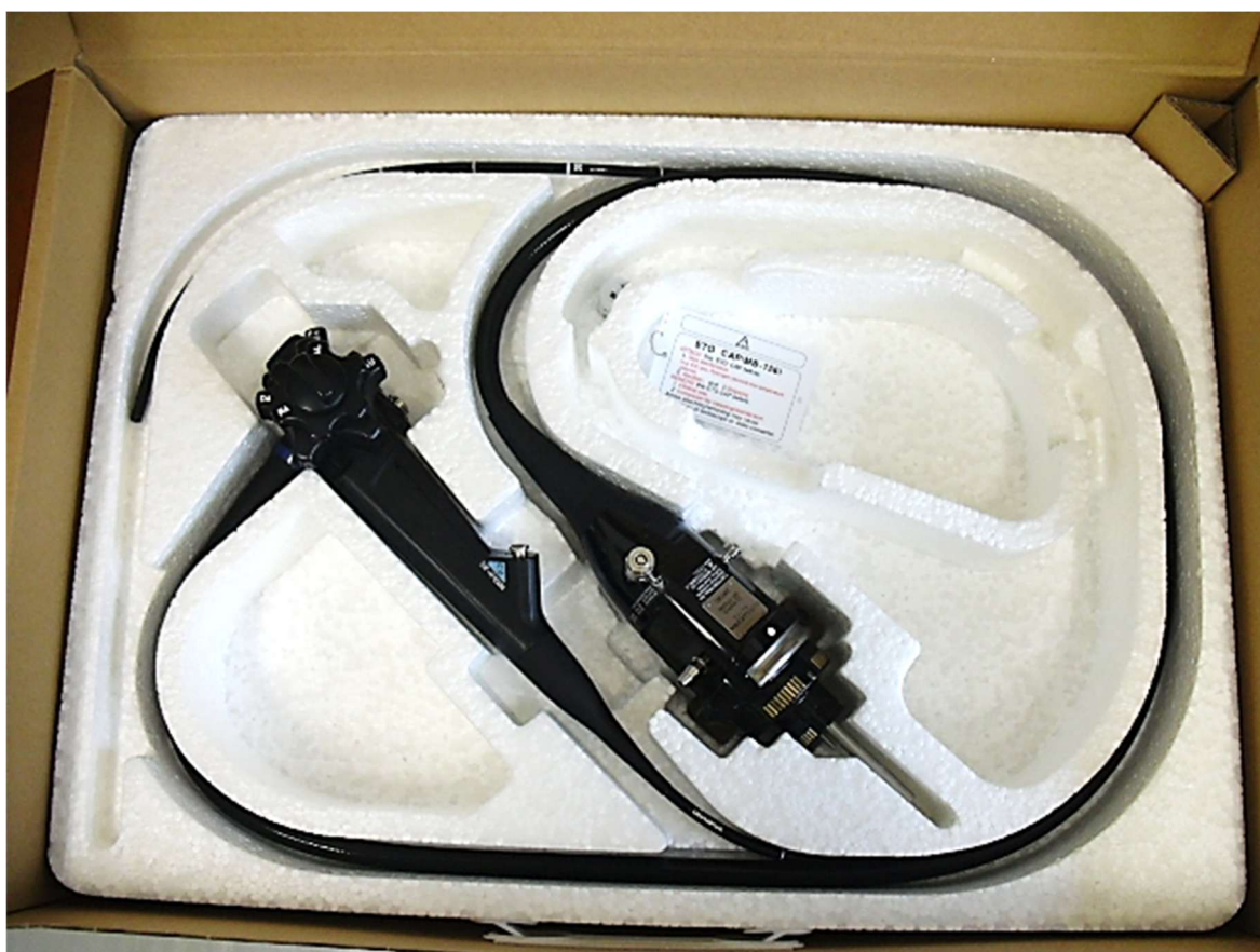
上部消化管ビデオスコープ GIF-XP290N (2013年製)