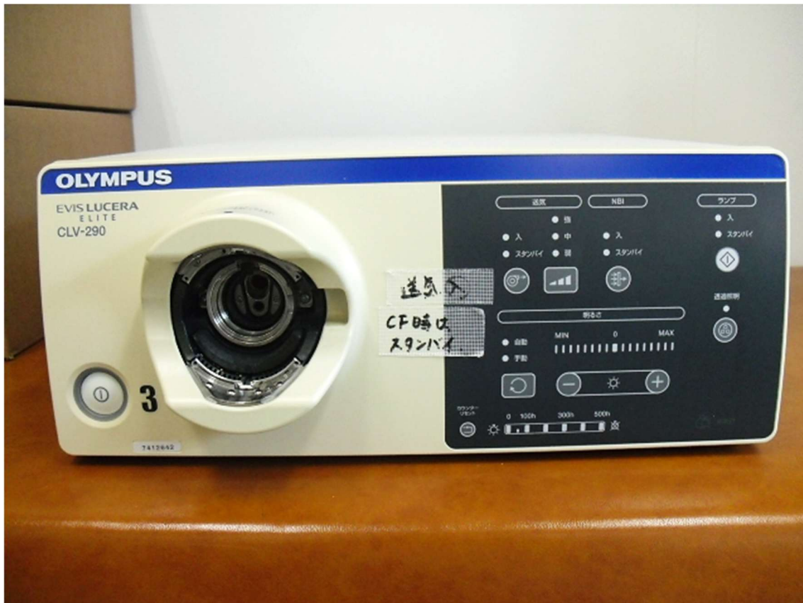
光源装置 CLV-290 (2013年製)