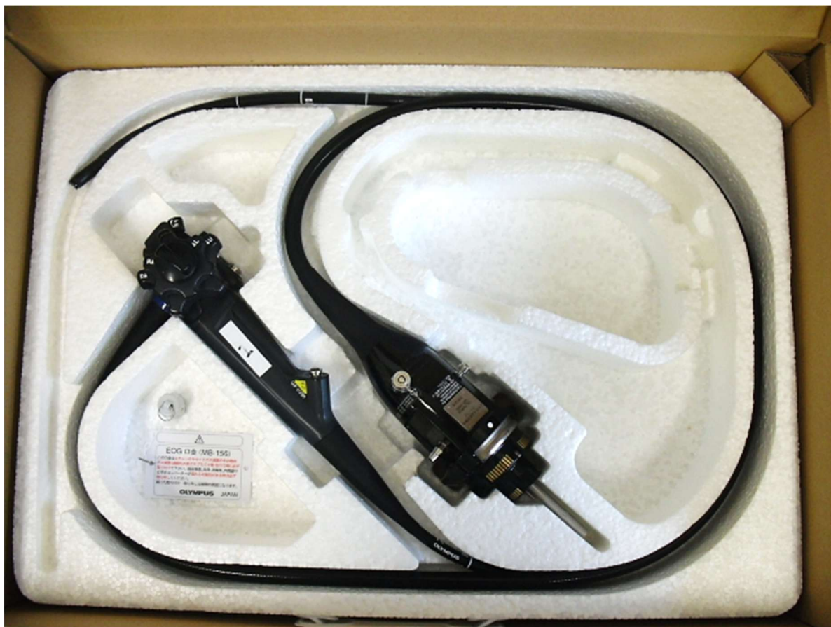
上部消化管ビデオスコープ GIF-H290 (2013年製)