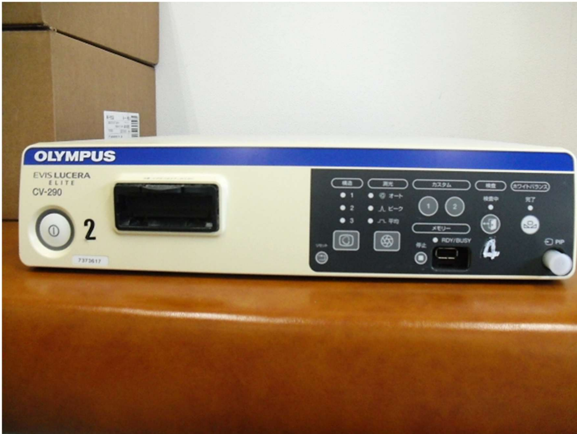
ビデオシステムセンター CV-290 (2013年製)