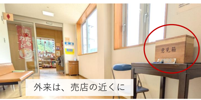
外来は、売店の近くに