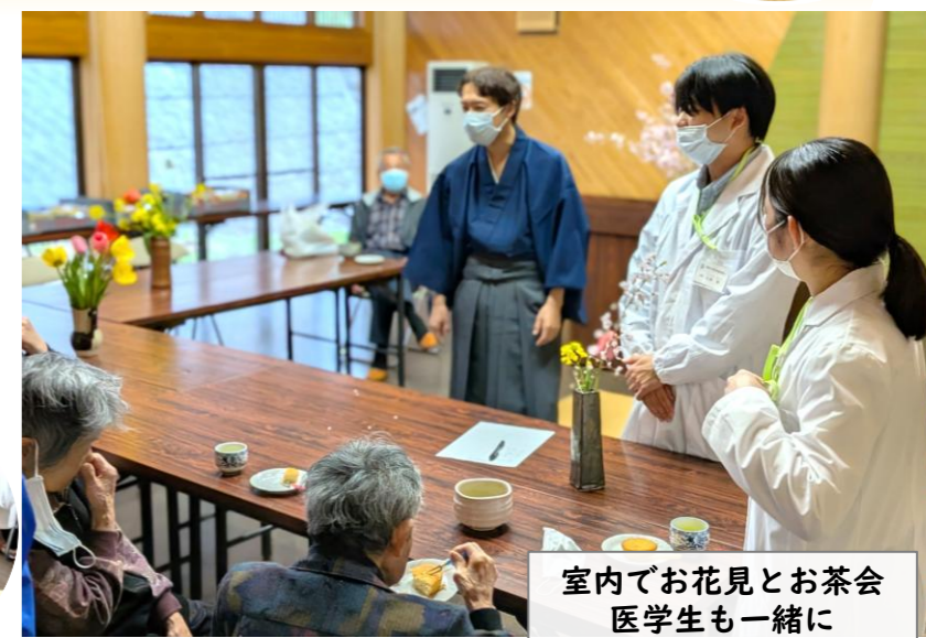
室内でお花見とお茶会 医学生も一緒に

令和8年4月15日、昼前から降り出した雨により、つるぎ会館の駐車場にはソメイヨシノの花びらが舞っていました。今年は例年よりも、少し季節の進みが早いように感じられます。