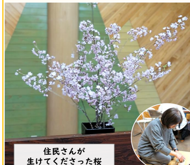
住民さんが 生けてくださった桜