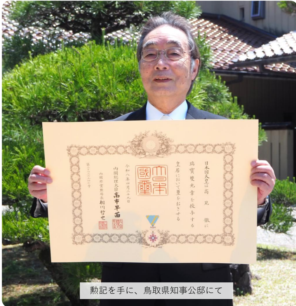
勲記を手に、鳥取県知事公邸にて