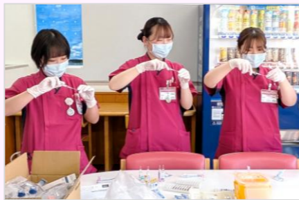
看護師になると、新人看護師はこんなオリエンテーションがあります!